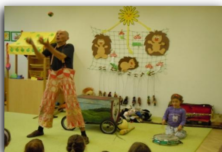
.....divadelní představení v mateřské škole...