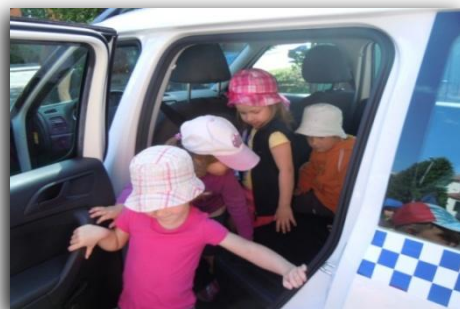
Městská policie Liberec .....v naší mateřské škole...