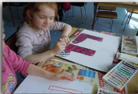
...výtvarná soutěž na ZŠ Liberec, Sokolovská 328, odloučené pracoviště náměstí Míru 212/2...