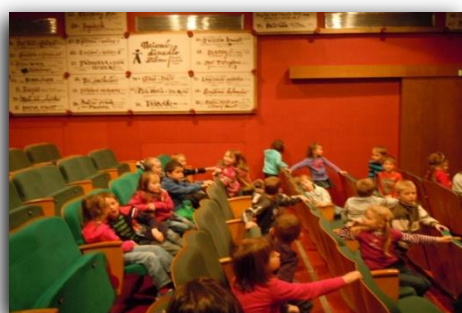
...představení v Naivním divadle Liberec...