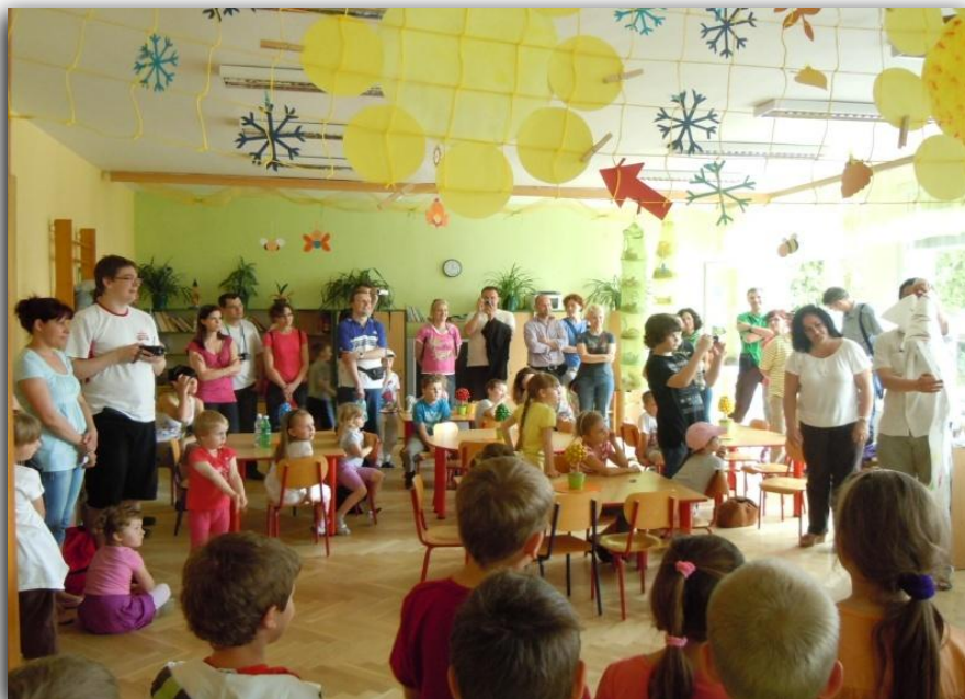
Milá návštěva dětí a rodičů z polské mateřské školy.....