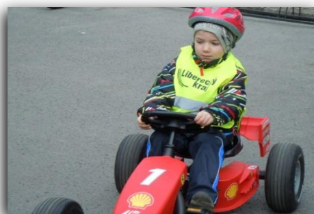
Výuka na dopravním brázdě.....