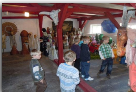
Výstava loutek v Naivním divadle Liberec.