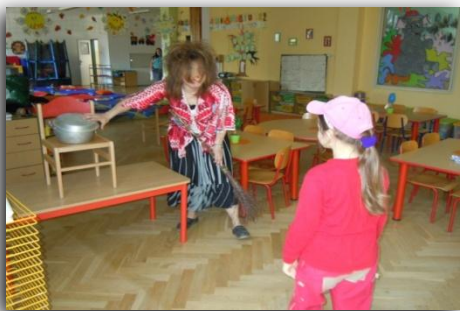
... překonáváme ostych...