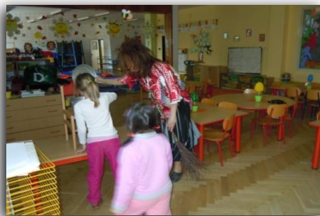
... zvědavost vítězí....