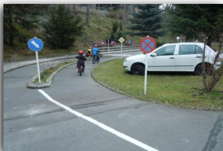
Návštěva dopravního hřiště v Pavlovicích.....

Mateřská škola Jablůňka pracuje podle programu prevence sociálně patologických jevů s názvem „Se-mafor zdravého života“, který je součástí ŠVP PV.