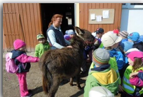
Výprava do jízďárny v Pavlovicích...

Zpráva o činnosti Mateřské školy „Jablůňka“, Liberec, Jabloňová 446/29, příspěvková organizace