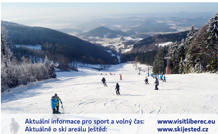
Aktuální informace pro sport a volný čas: www.visitliberec.eu Aktuálně o skí areálu Ještěd: www.skijested.cz

A co konkrétně na nejlepší lyžaře čeká? Třicítka nejúspěšnějších se v rámci postupu do semifinále zúčastní lyžařského kempu s full servisem.