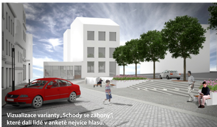
Vizualizace varianty „Schody se záhony“, které dali lidé v anketě nejvíce hlasů.