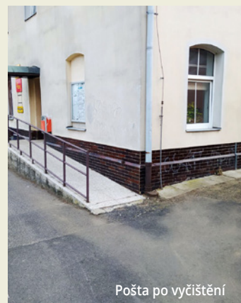
Pošta po vyčištění