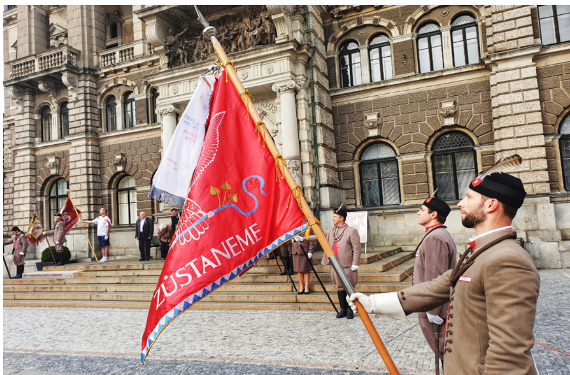
Liberečtí sokolové před libereckou radnicí uctili Památný den sokolstva, který nově připadá na 8. října. Viz str. 2.