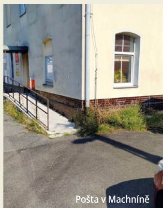
Pošta v Machníně