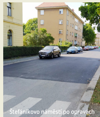
Štefánikovo náměstí po opravách